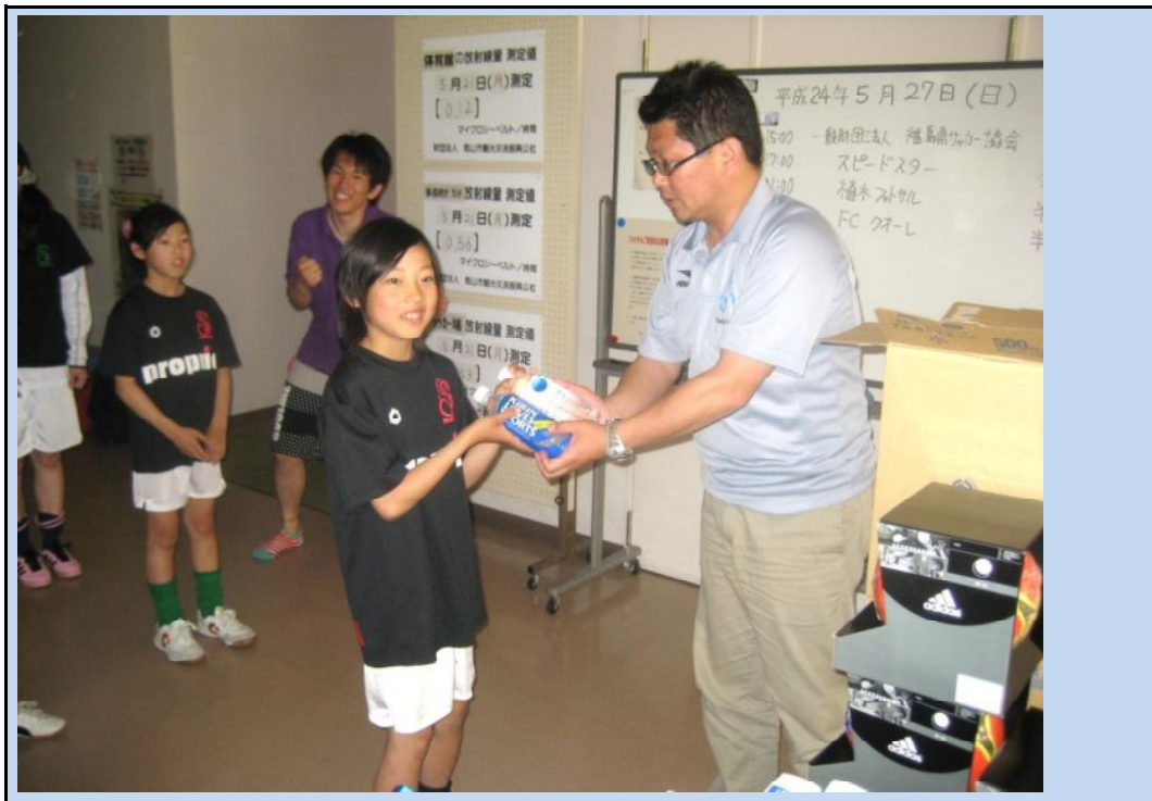
⑭ 参加賞お渡し風景(JFA/オフィシャルパートナーからの提供物を渡している様子)